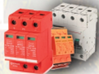
Parafoudres AC & DC Disjoncteurs AC & DC

2es Construisons Ensemble un Burkina sans Délestage