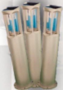
Lampes de Jardin