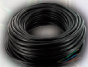
Cable solaire et électrique