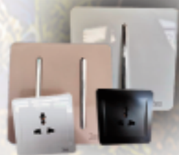
Interrupteurs & Prises