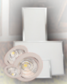
Panels & Spot LED